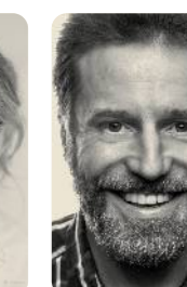
CORNELIUS MALERCZYK Theaterfotos | Animationen