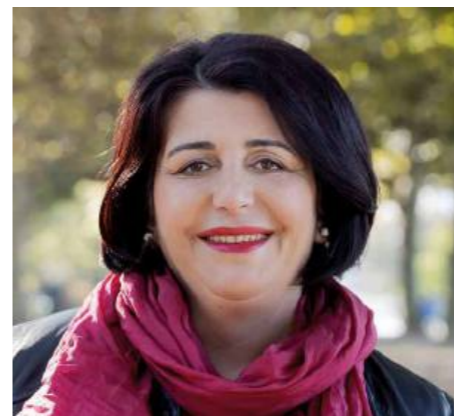
Mike Josef Oberbürgermeister der Stadt Frankfurt am Main

Ich bin begeistert, dass unsere Stadt Frankfurt so vielfältige Möglichkeiten für Kultur und künstlerische Entfaltung bietet und möchte Ihnen meinen Respekt für Ihr langjähriges Engagement bekunden. Sie leisten einen wertvollen Beitrag für die lebendige und vielfältige kulturelle Szene, die unsere Stadt prägt. Ihre Erfolge sind auch in Ihrer positiven Sicht der Dinge begründet, mit der Sie sich Ihrem künstlerischen Engagement widmen. All den großen und kleinen Theater- und Musikbegeisterten wünsche ich ganz viel Freude im Papageno Musiktheater - lassen Sie sich begeistern und tauchen Sie ein in eine zauberhafte Welt!