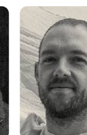
TOMAS KLEINER Bühnenbild