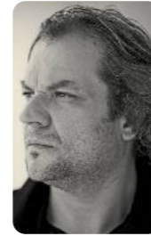
ŽELJKO LUČIĆ Bariton