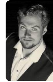
TIMON FÜHR Bariton