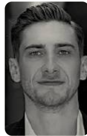
NIKLAS MAIENSCH Regie