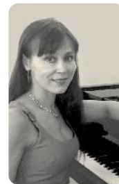
IRINA FUNDILER Musikalische Leitung | Klavier