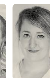
MIRIAM BORGERS IMMERWIEDER DESIGN Grafik